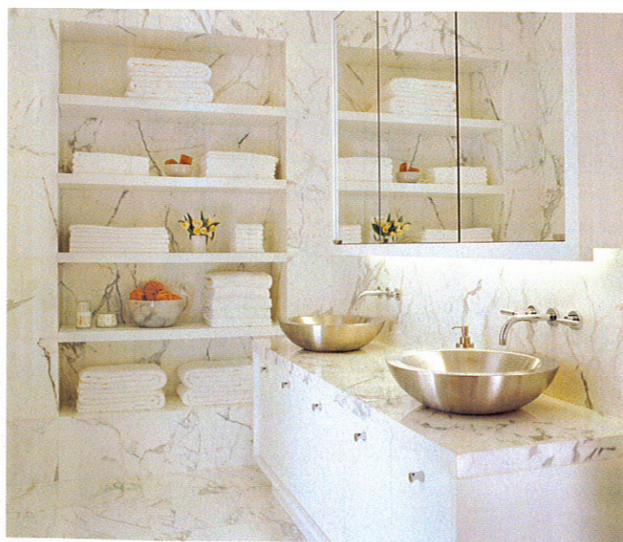
Totalmente reestruturado, o banheiro ganhou revestimentos em mármore Calacata Visione nas paredes, no piso e na bancada

Nesse apartamento, a simplicidade comparece em grande estilo como destaque estético em que a sutileza das cores e das formas de linhas retas brindam de charme a morada. A decoração faz um ensaio clássico-moderno em que o pouco diz muito, seja por meio da nobreza do mobiliário, seja pela paleta de cores neutras.